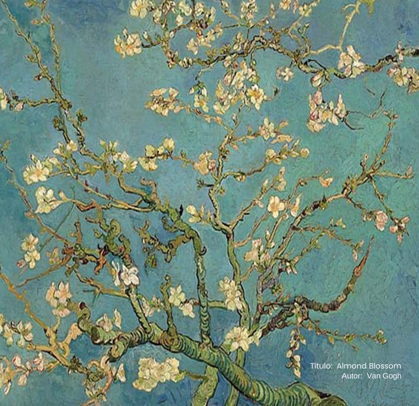
Título: Almond Blossom Autor: Van Gogh