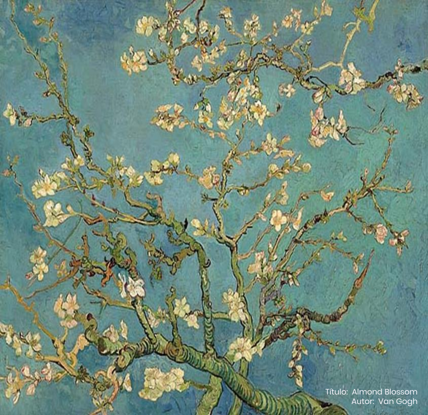
Título: Almond Blossom Autor: Van Gogh